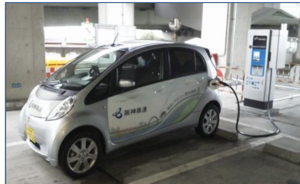
（急速充電器イメージ）