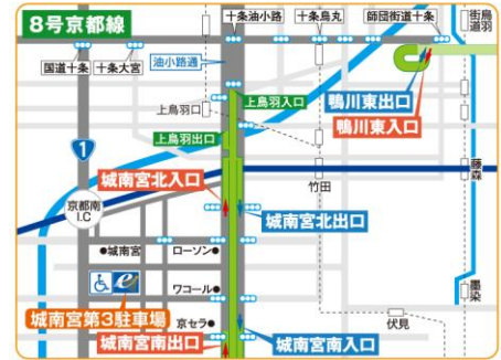
城南宮 近日サービス開始予定