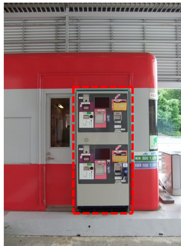
設置後【西宮山口南(東行)料金所】 (点線部が新設の自動収受機)