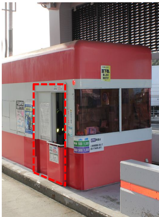
設置前 (点線部が料金所スタッフ収受位置)

自動収受機は、第1レーン(進行方向に向かって右側)料金所ブースの料金所スタッフ収受位置に埋め込まれています。