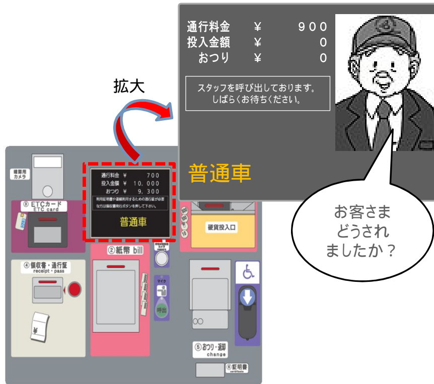
自動収受機接客部(イメージ)

自動収受機設置レーンは、『一般』または『ETC / 一般』で運用します。『ETC / 一般』をETC車で利用される場合は20km/h以下でレーンに進入し、開閉バーが開いたことを確認して走行してください。