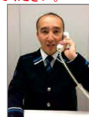
(画面表示は、イメージです)

料金所ご通行時点で何らかの理由でETC無線通行をご利用できない場合は、8の「呼出ボタン」を押していただき、スタッフに「車載器を搭載している」旨を伝えていただいたうえで、5にETCカードを挿入してください。