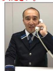
(画面表示は、イメージです)

料金所ご通行時点で何らかの理由でETC無線通行をご利用できない場合は、 8 の「呼出ボタン」を押していただき、スタッフに「 車載器を搭載している 」旨を伝えていただいたうえで、 5 にETCカードを挿入してください。