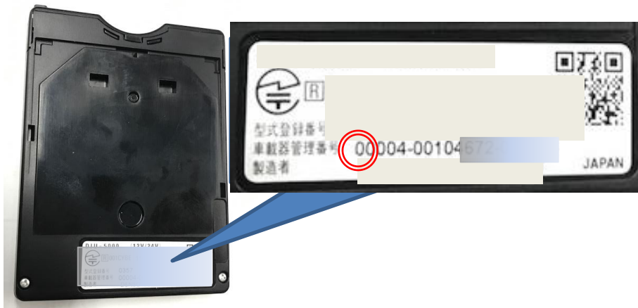
(写真) : 旧セキュリティ対応車載器