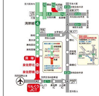
終日通行止めの概要