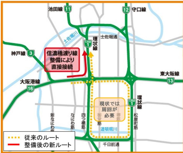
従来ルートと新ルートの違い

西船場ジャンクション改築事業では、16号大阪港線東行きと1号環状線北行きとを直接接続する信濃橋渡り線の新設を行います。また、信濃橋渡り線設置にあわせ、1号環状線および16号大阪港線の一部車線拡幅、渡り線と干渉する信濃橋入口の撤去・再構築を行う事業です。