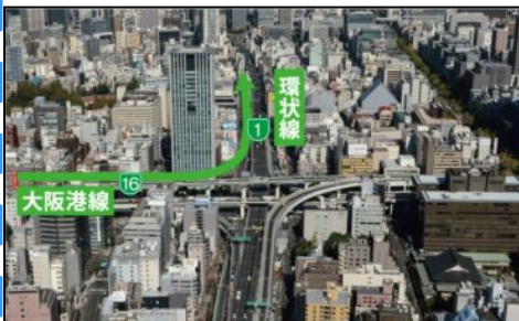
信濃橋渡り線のイメージ