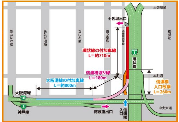
西船場ジャンクション（信濃橋渡り線）改築事業概略図