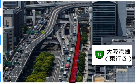
現在の阿波座合流部付近の状況