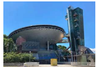
堺市立ビックバン

人気の屋内遊び場"堺市立ビックバン"や「自分にあった公園利用をデザインする」をコンセプトにした話題の施設"Design Ohasu Days"など、注目スポットも満載！