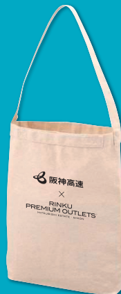
ショルダートート