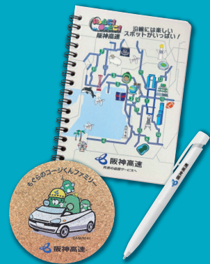
選べるノベルティ