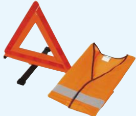
(エーモン6647ベスト付き)

パンクや故障などで車がやむをえず止まった時、慌てずできるだけ路肩に寄せ、車のうしろ数十メートルの後続車両から見やすいところに三角停止板を設置します。追突事故を避けるため表示義務があります。