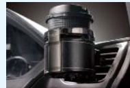
(カーメイトDZ343クアトロ)