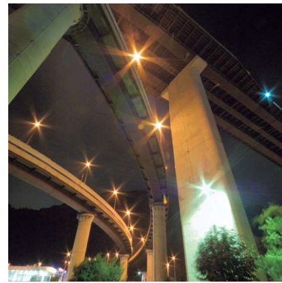
カメラ：ニコン D100 レンズ：シグマ 10-20mm F/4-5.6G 10mm シャッター：30秒 絞り：F/13

漆黒の闇と、煌びやかなネオンの コントラストが美しい。 空と街と水が織りなす、絶景がここに。