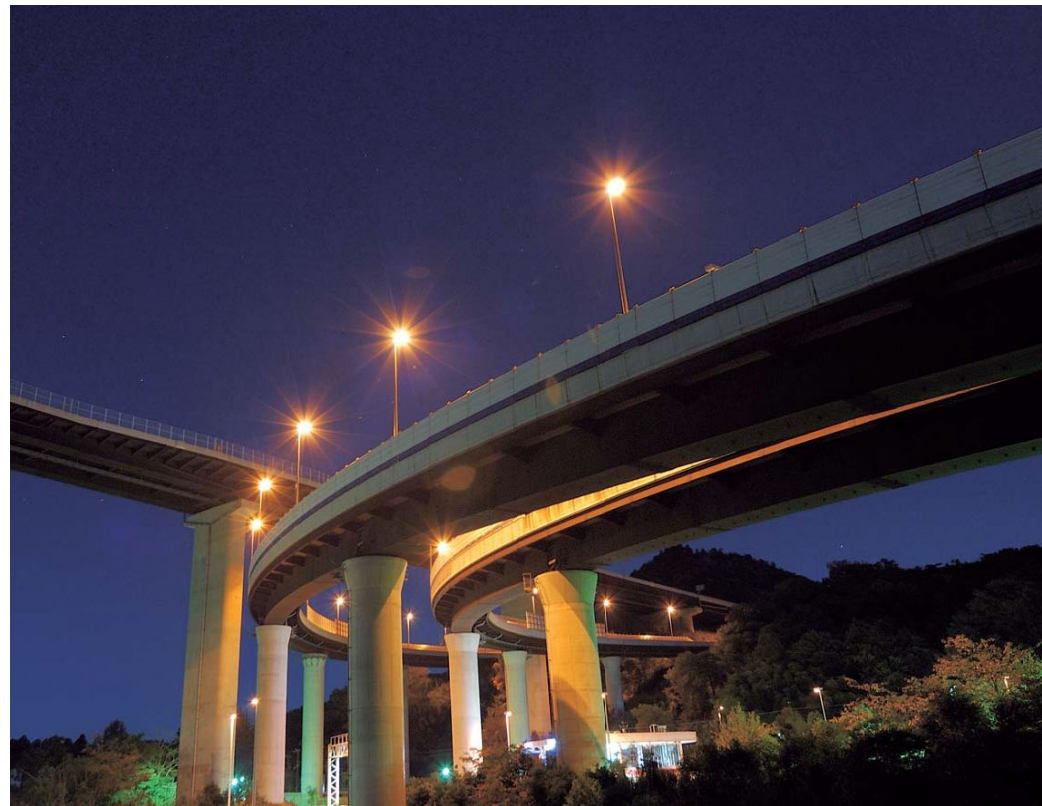
●五社ランプ カメラ：ニコン D100 レンズ：シグマ 15-31mm F/3.5-4.5D 16mm シャッター：25秒 絞り：F/7.1