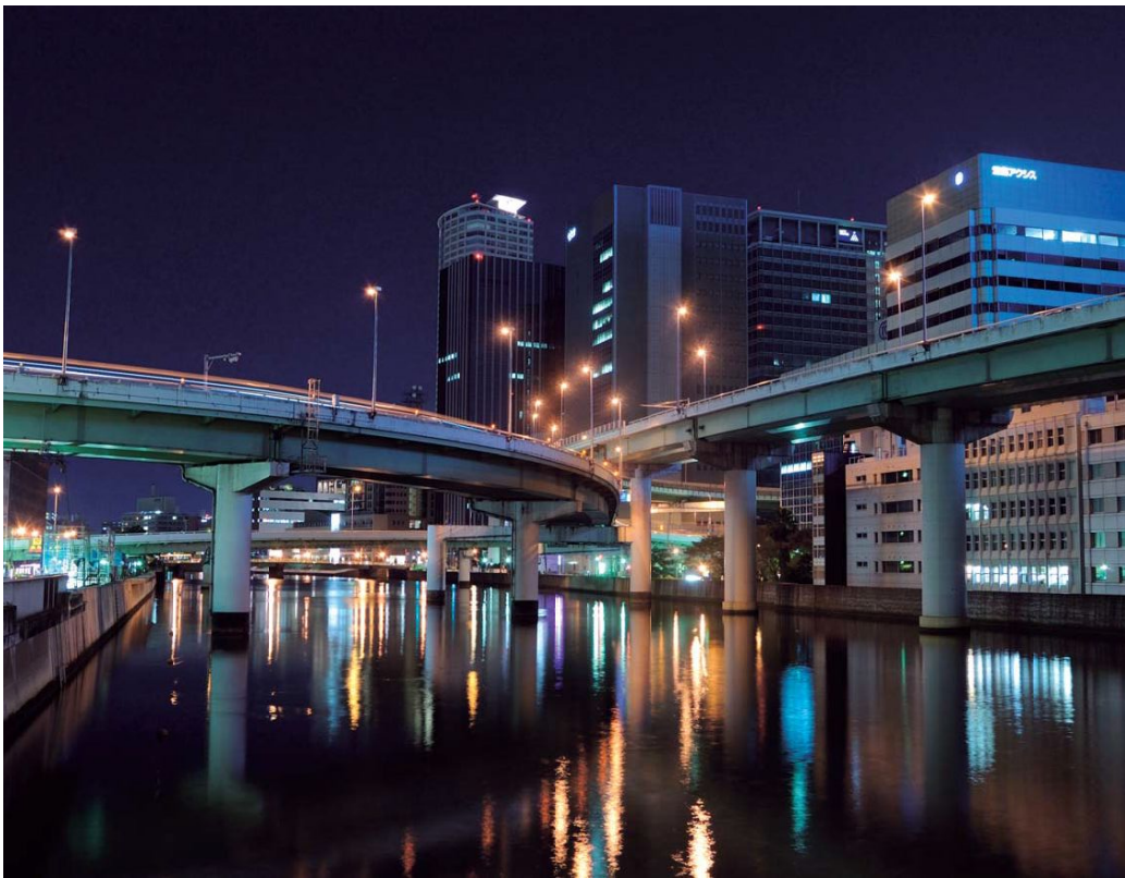
●中之島分岐 カメラ：ニコンD40 レンズ：ニコン 18-55mm F/3.5-5.6G 23mm シャッター：8秒 絞り：F/8