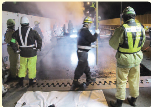
舗装工事は、春や秋などの季節が適しています。降雨も品質に影響することから、なるべく気候が安定した時期を選びます。