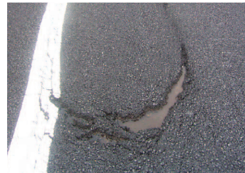
舗装がはがれて雨水がたまった状態