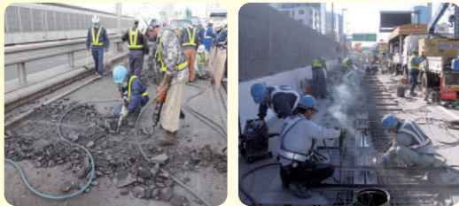
路面を削る作業の時に、大きな音が発生します。