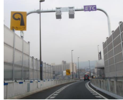
(ETCフリーフローアンテナ)

料金所が無い出口では、車載器搭載車に通行に対する音声案内が通知されます。 ※案内の内容は、車載器メーカーにより異なります。