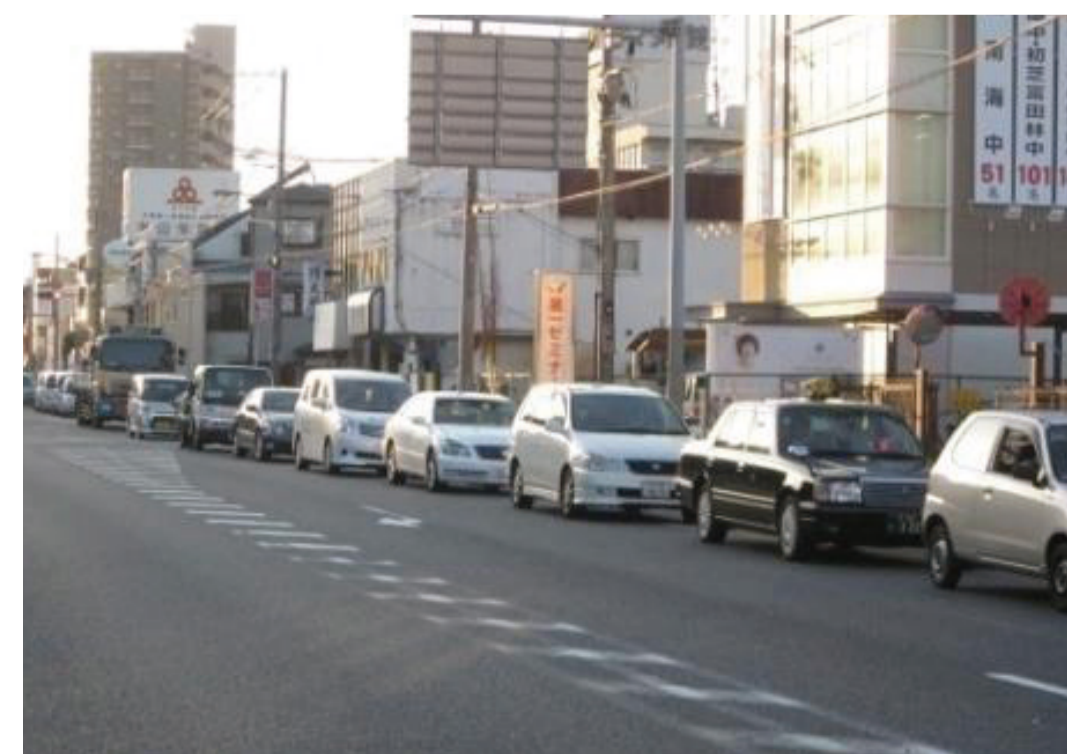
蔵前町西交差点の渋滞状況