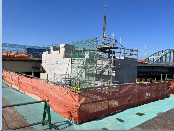
①橋脚柱・梁部の コンクリート打設