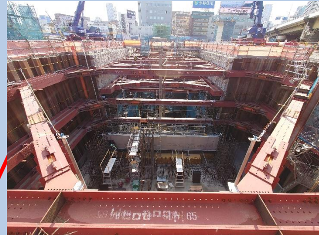
②換気塔部の躯体工