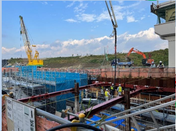
③擁壁部の側壁コンクリート打設