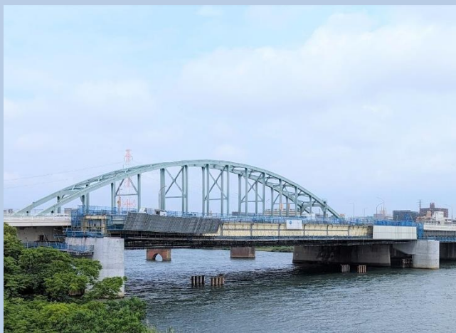
①河川内ベント撤去