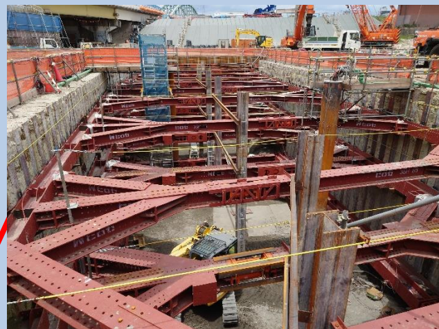
②換気塔部の掘削・土留支保工