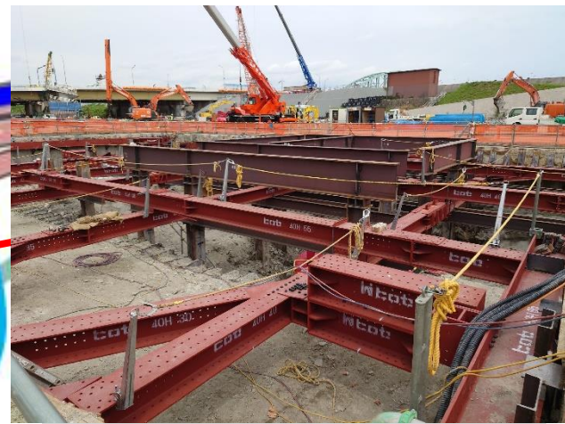
④受電所部の掘削・土留支保工