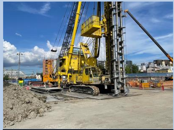
②地中連続壁 (土留) 施工