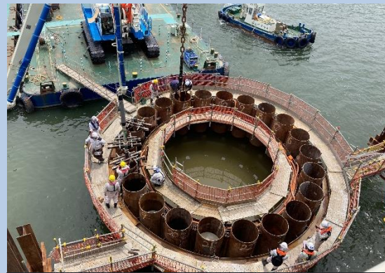
①河川内の鋼管矢板内への 中詰めコンクリート打設