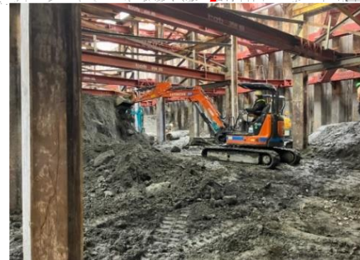
④トンネル部の地盤掘削