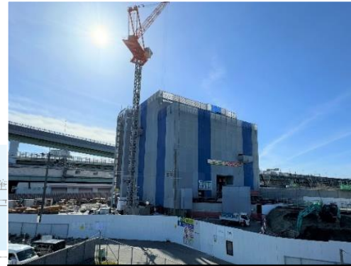
③換気所4階部の構築