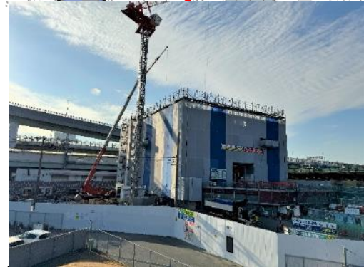
④換気所2階部の構築