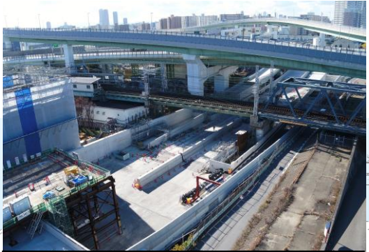
②掘割擁壁部の構築