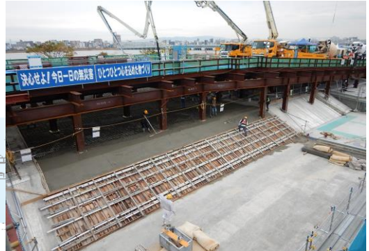
③トンネル本体の構築