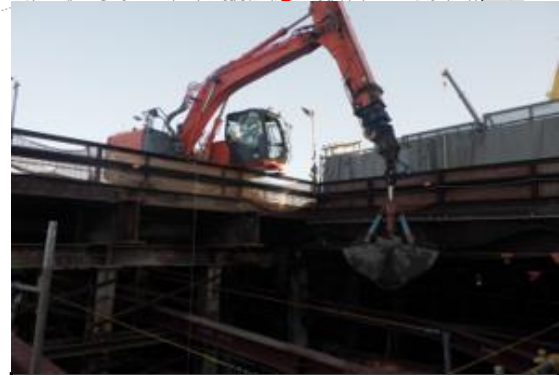
⑤トンネル部の地盤掘削