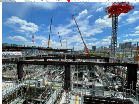
⑤換気所地下部の構築