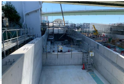
②掘割擁壁部の構築