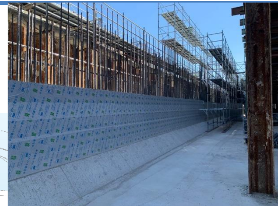
③トンネル本体の構築