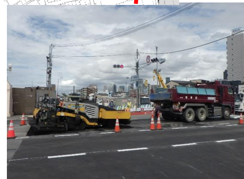
⑥国道2号の切り替え