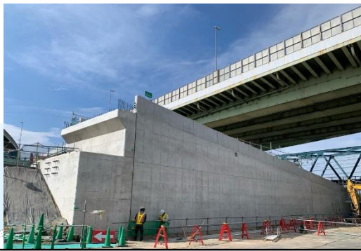
②掘割擁壁部の構築