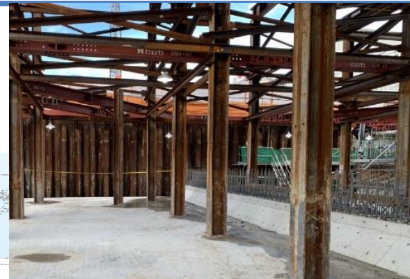
③トンネル本体の構築