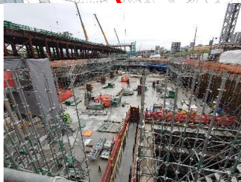
⑤換気所地下部の構築