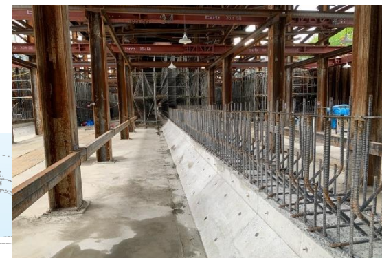
③トンネル本体の構築