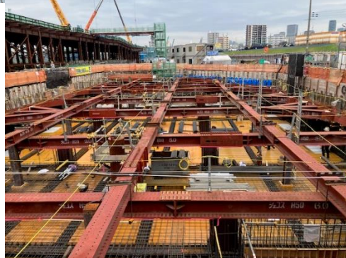
⑤換気所地下部の構築