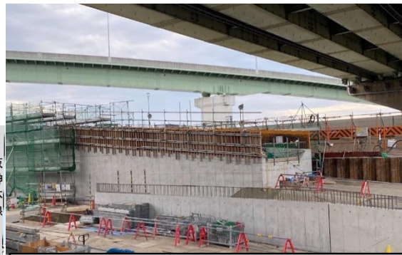
②掘割擁壁部の構築