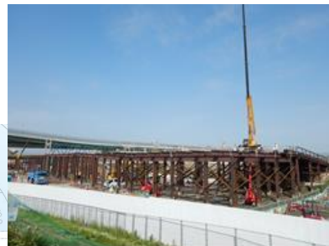
④工事用栈橋の設置