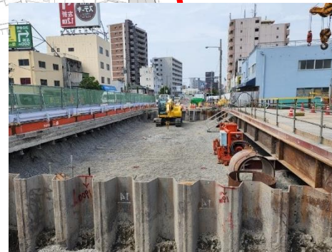
⑧栈橋のための杭を設置