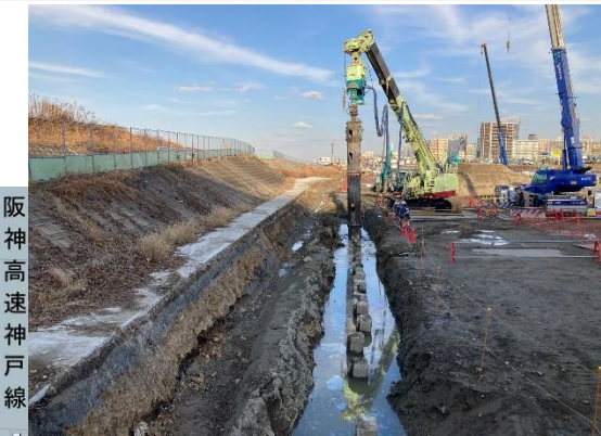
旧中津川護岸基礎杭の引抜き