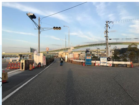
大阪市道459号線通行止め