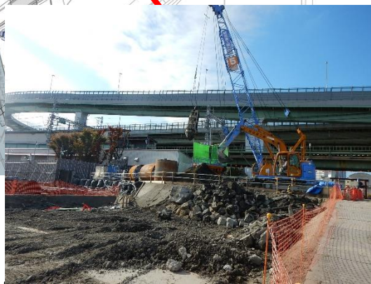
歩道橋基礎部分の撤去