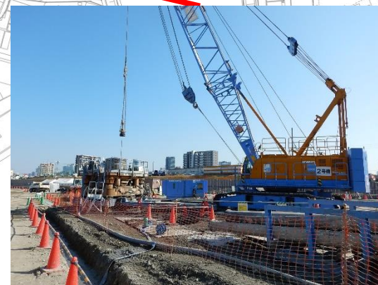
工場の基礎杭撤去