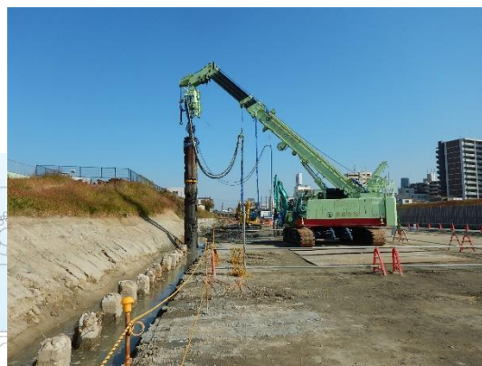
旧中津川護岸基礎杭の引抜き