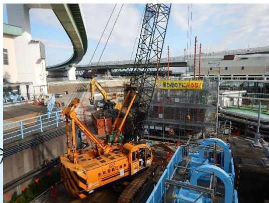
橋梁基礎の構築(掘削)