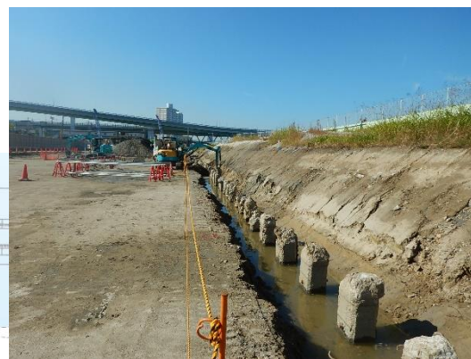
旧中津川護岸基礎杭部の掘削