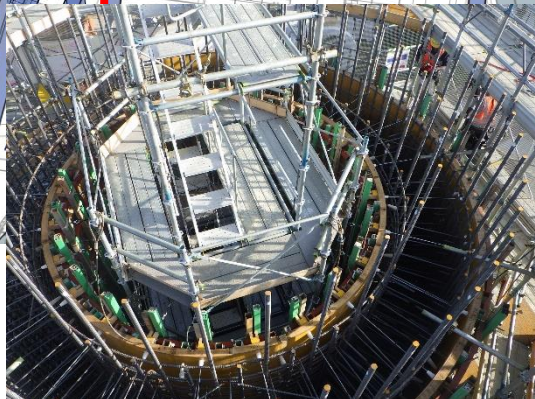
橋梁基礎の構築 (鉄筋組立)