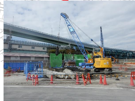
工場の基礎杭撤去