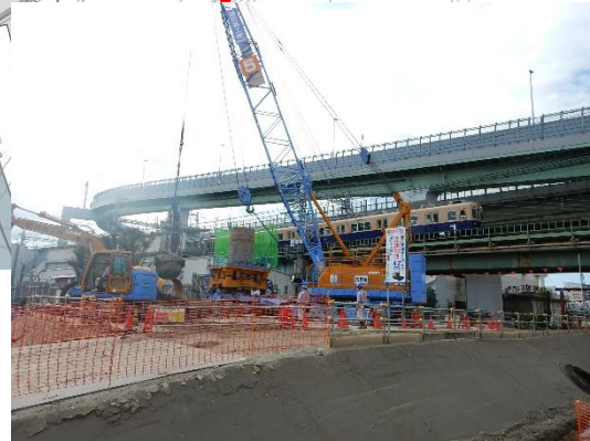
歩道橋基礎礎部分の撤去