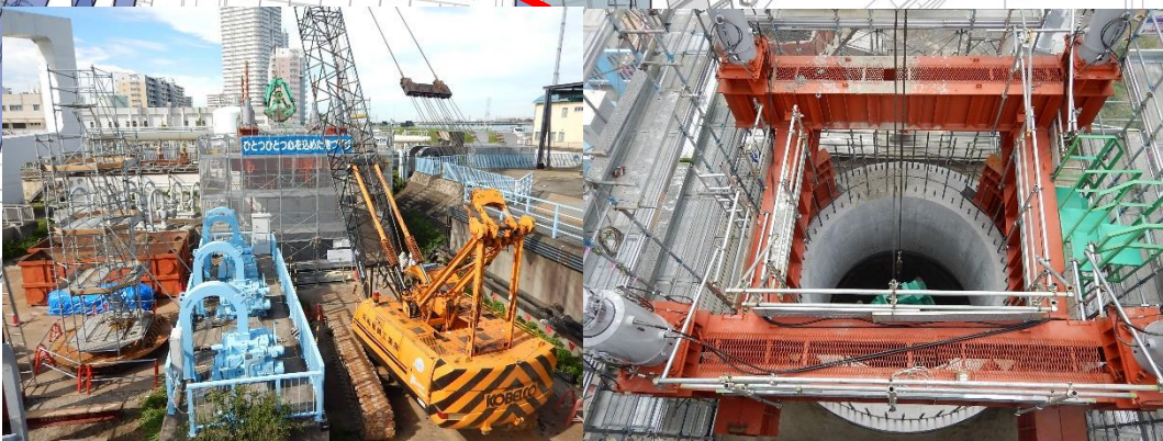
橋梁基礎の構築（掘削）