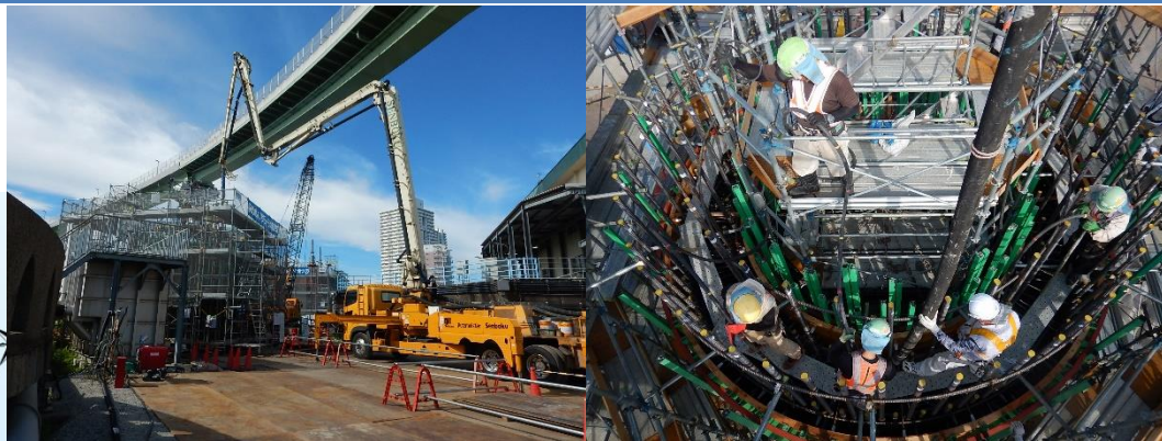
橋梁基礎の構築（コンクリート打設（左：外観 右：内部））