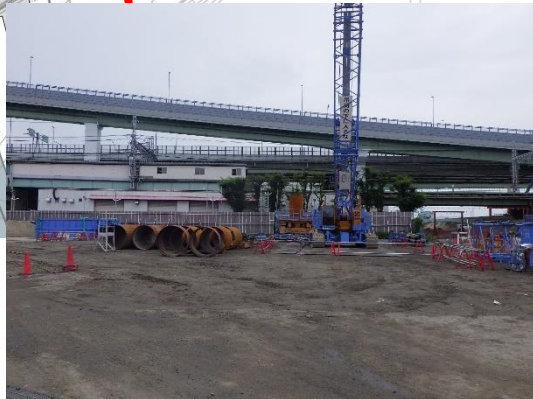
工場の基礎杭撤去の準備