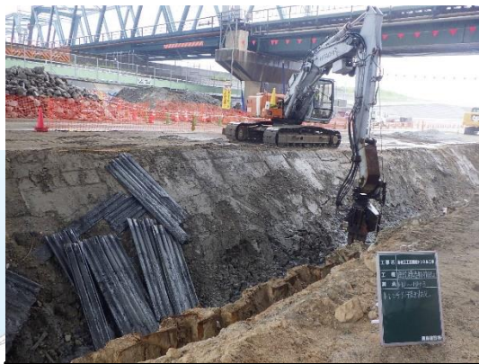
地中に残る鋼矢板の引抜撤去