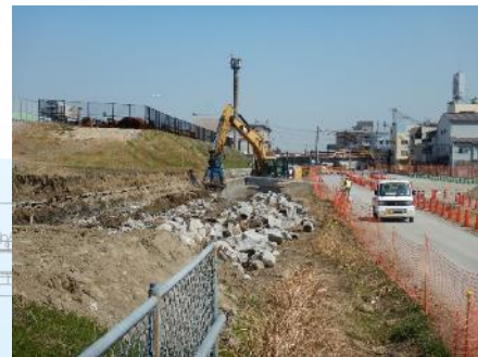
旧中津川護岸の撤去