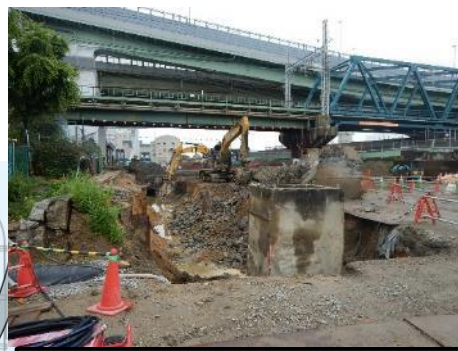
工業用水道管撤去