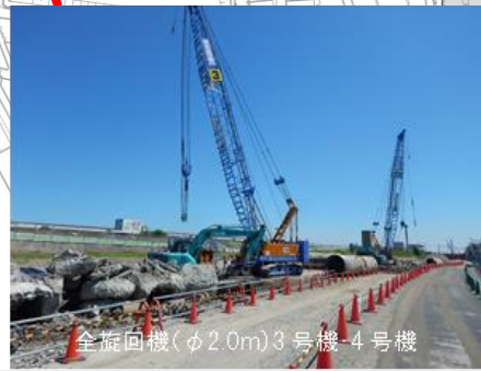
全旋回機(φ2.0m)3号機・4号機