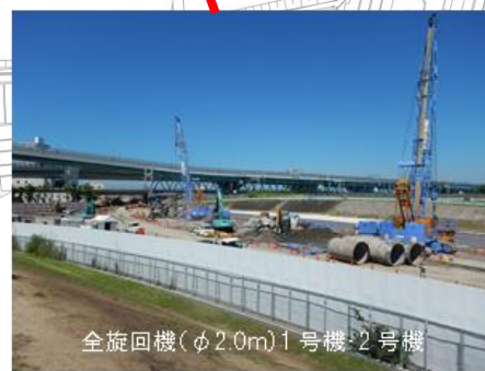
全旋回機(φ2.0m)1号機・2号機