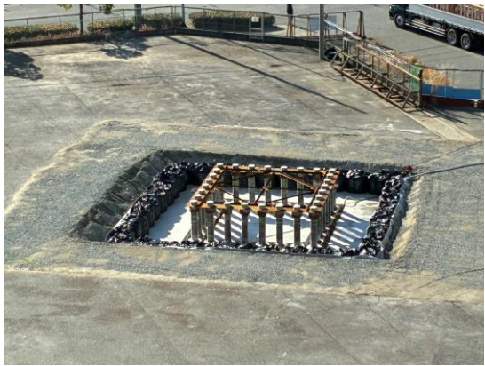
【1】橋脚工事(PPE-1)において、埋戻し完了