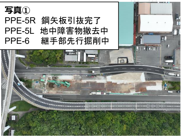
写真① PPE-5R 鋼矢板引抜完了 PPE-5L 地中障害物撤去中 PPE-6 継手部先行掘削中