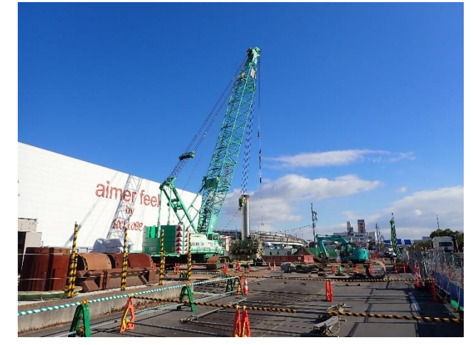
【3】高速道路の橋脚(PPE-5R)基礎工事に おいて、オールケーシング工法を用いて 地中障害物の撤去中。