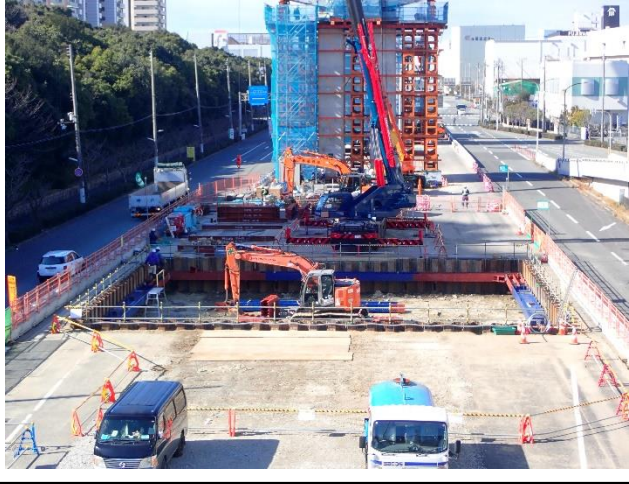
【1】高速道路の橋脚(PE-1)基礎工事に おいて、土留支保工の設置中。