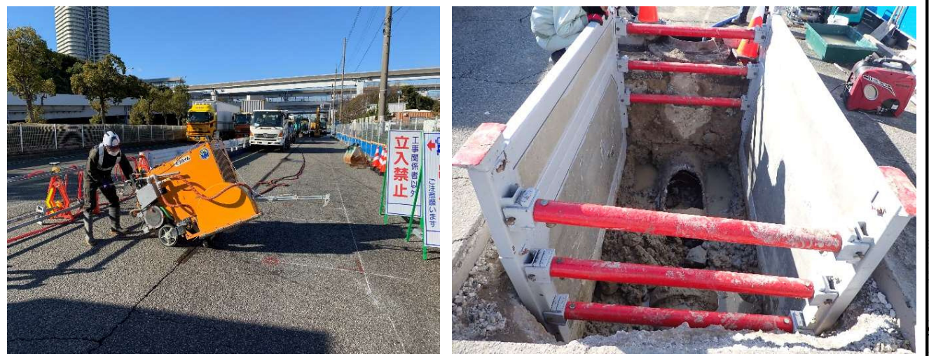
①橋脚の基礎と抵触する雨水管の事前撤去工事を実施しています。(PPE-5付近)