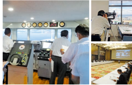
海上長大橋を想定し航路の安全をシミュレーション。ポートアイランドにある「神戸港海上工事航行安全情報管理室」では、海上工事の情報を提供し、一般船舶の航行安全を監視しています。

われわれ神戸海難防止研究会は、大阪湾岸道路西伸部の海上工事に伴う安全対策検討を計画段階から実施しており、引き続き、海上工事が円滑に進められるとともに工事の実施中に神戸港を訪れる一般船舶等が安全に航行できるよう取り組んでいきます。