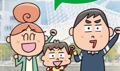
大阪南部エリアに在住のAさん一家

現在、建設が進む大阪湾岸道路西伸部。完成すれば、阪神臨海地域の交通渋滞が緩和され、阪神港の物流の効率化、災害や事故など緊急時の代替機能確保に加え、多彩な観光資源に恵まれる神戸周辺の魅力がさらに発揮されることが期待されています。