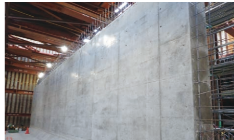
トンネル本体工を進めています。一部では側壁が立ち上がり、トンネルの全容が見えつつあります。

そのため、各施工箇所ですべての地下埋設物管を移設しているほか、近接する既設のトンネルに影響を及ぼさないよう対策を講じつつ、また民家が隣接していることを踏まえて、防音、防振、防塵対策など周辺環境に配慮しながら施工を進めています。