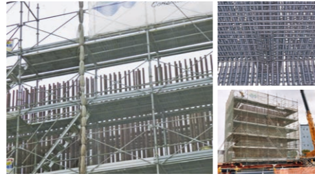
コンクリート打設前の橋脚。国内で最も太い鉄筋を使用しています。

また、工事前には各工程を3次元CADで立体的に表現し、施工ステップのシミュレーションを行い効率的かつ安全に作業が完了しました。