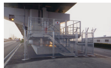
変電塔のかさ上げ

南海トラフ地震などにより津波が発生し大規模災害となった場合にも、災害対応活動を継続して実施するため、本社に非常用発電装置を備えた常設の災害対策本部室を整備しています。道路管理施設や電気通信施設の浸水対策、電源確保の強化、応急復旧資材の備蓄などを進め、早期に道路サービスを再開し、道路（緊急輸送道路）機能を確保するよう努めています。