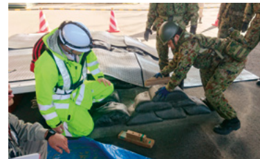
自衛隊との合同実動訓練

そのほか、陸上自衛隊と緊急車両の通行、資機材の提供などの連携に関する協定や建設関係団体と被害状況の調査、資機材の調達や応急対策に関する協定を締結するなど、関係機関との連携を図っています。