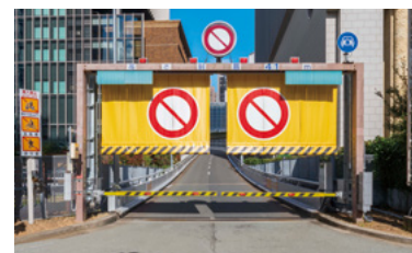
入口遠隔閉鎖装置

大阪北部地震（2018年6月）の際は、交通管理隊が現地で高速道路入口の閉鎖操作をする必要があり、安全確認に時間を要しました。震度5強以上の地震が発生した際、遠隔操作ですばやく高速道路入口を閉鎖し、お客さまの安全を守る入口遠隔閉鎖装置の整備を86箇所で行っています。新たに21箇所の高速道路入口にも整備を予定しています。