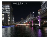
ライトアップによるにぎわい創出