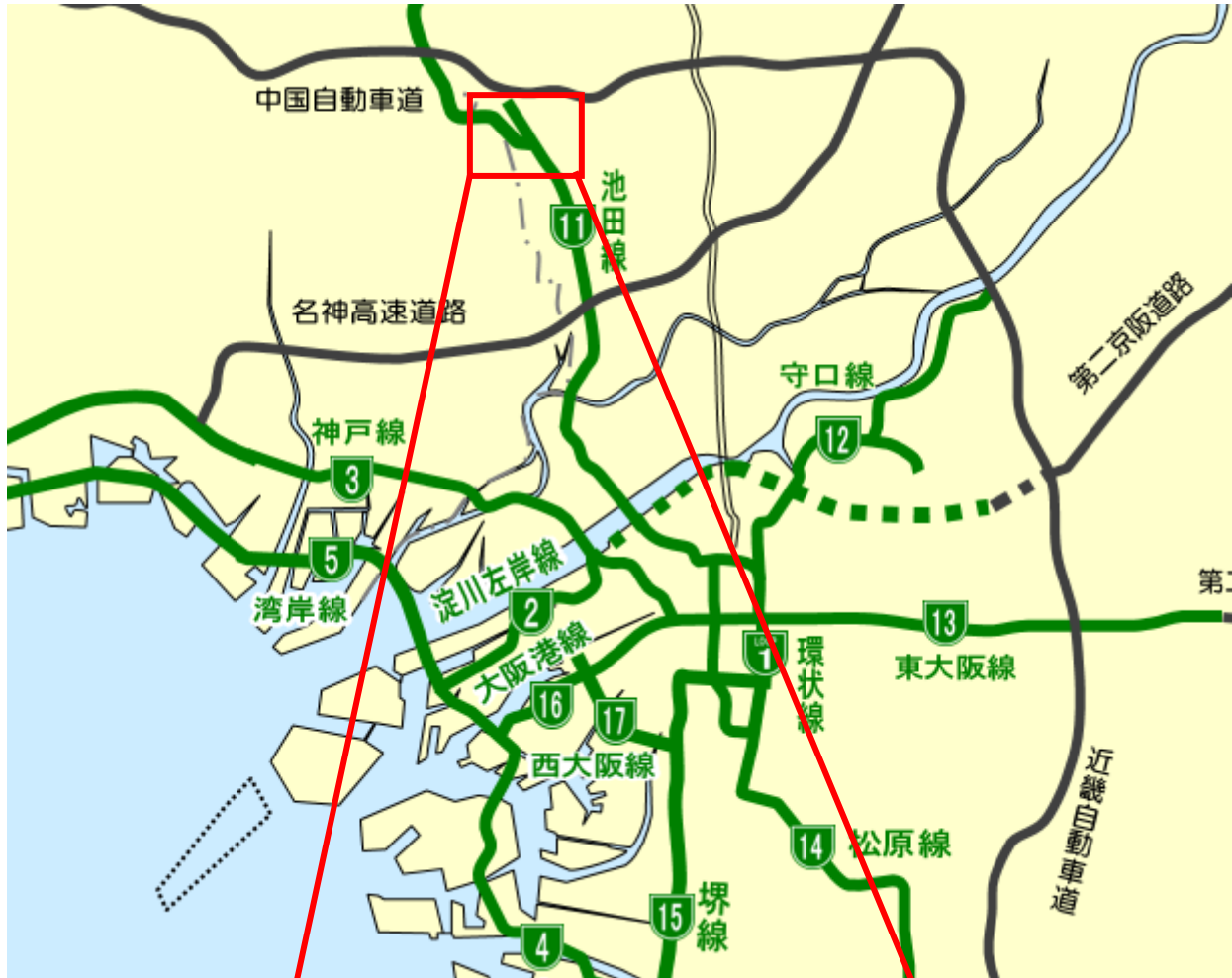
大阪空港本線料金所