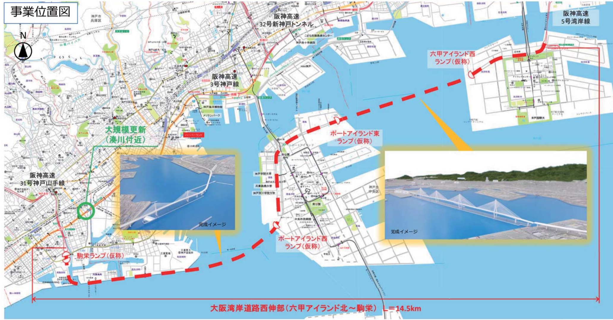
大阪湾岸道路西伸部（六甲アイランド北～駒栄）