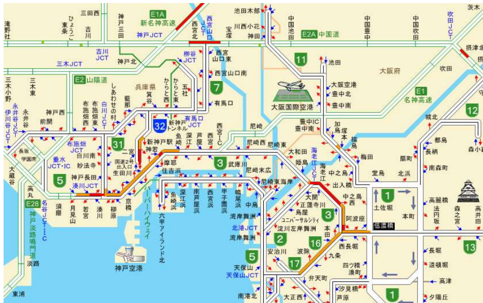
(例) 平成 30 年 8 月 13 日 (月) 18 時頃