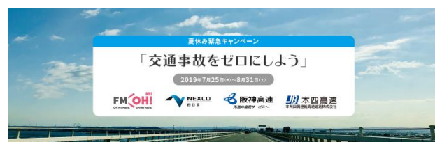
【夏休み緊急キャンペーン「交通事故をゼロにしよう」イメージ写真】